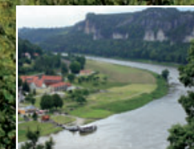
Blick auf Oberrathen