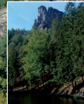
Amselsee bei Rathen